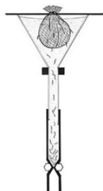
Gambar 2. Prinsip pemeriksaan dengan Baermann Technique (BM).

Prinsip dari pemeriksaan Baermann Technique seperti pada gambar 2. Pemeriksaan ini untuk mendeteksi larva stadium 3 helminth. Hal ini menggunakan prinsip bahwa larva dari kantung yang berisi feses aktif bermigrasi ke dalam corong air sehingga corong air yang diperiksa dengan mikroskop akan menunjukkan adanya larva stadium 3 dari helminth. Pemeriksaan ini dapat dilihat hasilnya kurang lebih setelah 30 menit. Biaya yang dikeluarkan dari pemeriksaan ini juga sangat murah.